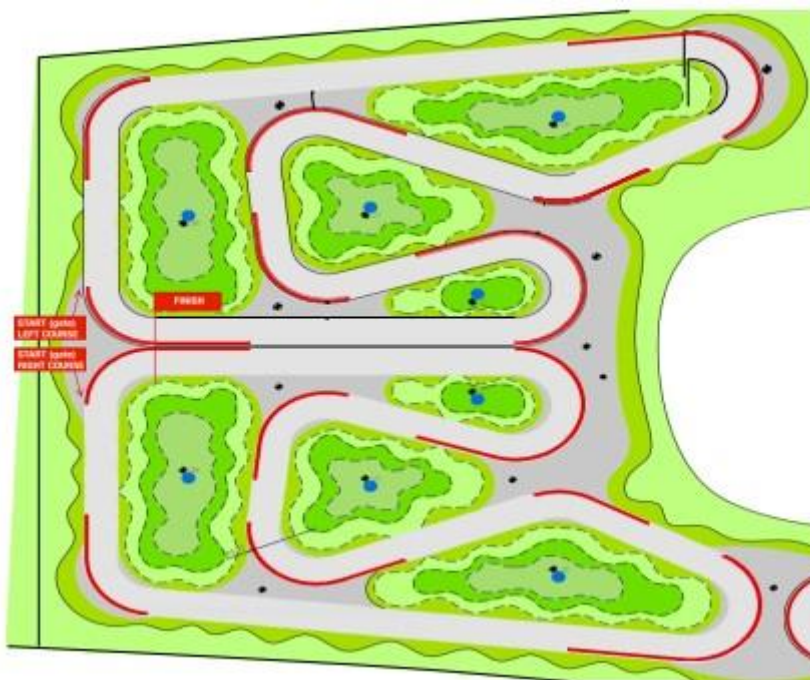
Primer postavitve proge in sistema za merjenje časa: tekmovalec proti tekmovalcu – paralelno.

V naslednji krog tekmovanja napreduje tekmovalec, ki je prvi dosegel 2 zmagi (točki).